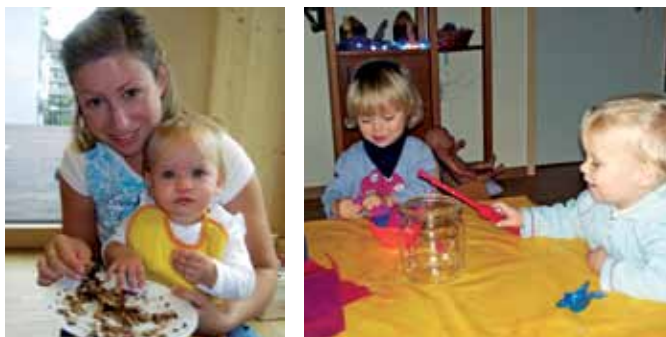
Ein behutsamer, Sicherheit spendender und liebevoller Umgang miteinander liegt uns sehr am Herzen.

Mit einer behutsamen Eingewöhnung und dem permanenten, vertrauensvollen Austausch mit den Eltern sehen wir uns als Erweiterung der Familie.