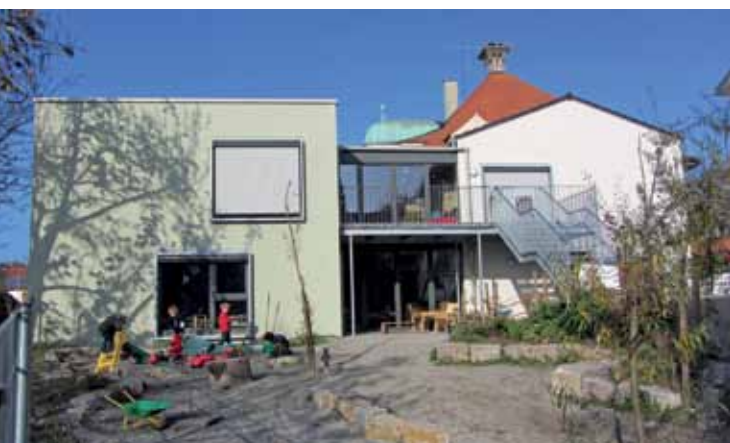
Unser neues Zuhause in Passivbauweise mit Naturspielgarten

Die aktuellen Preise für die Buchungszeiten und das Mittagessen bitte dem Einlegeblatt entnehmen.